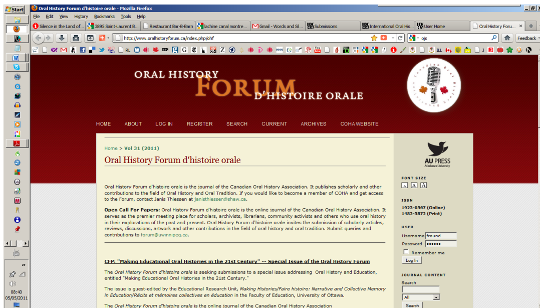
Pantalla 3. El rediseño de la apariencia en línea después de que el Oral History Forum d'histoire orale se mudó a Athabasca University Press a principios de 2010.

des ventajas de la publicación en línea es la inmediatez de Internet. Cualquier artículo o contribución puede publicarse de manera inmediata después de pasar por todos los pasos editoriales; no hay necesidad de esperar a que todos los artículos estén listos para ser publicados y no se tiene que esperar a que la revista sea imprimida. Para explicar mejor lo que quiero decir, describiré cómo funciona la publicación de nuestra revista.